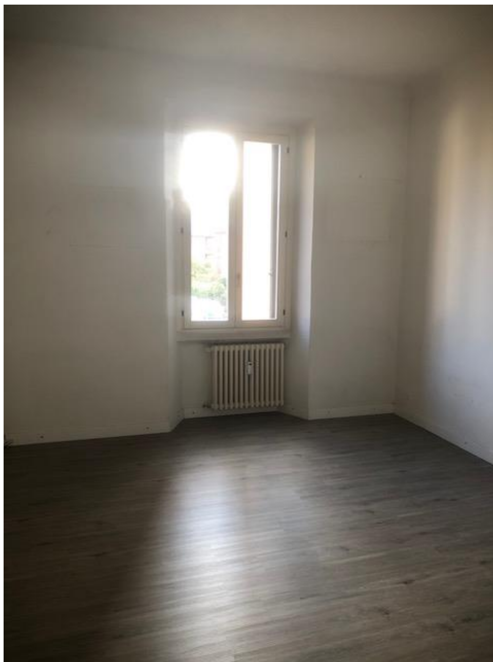
Vista della camera