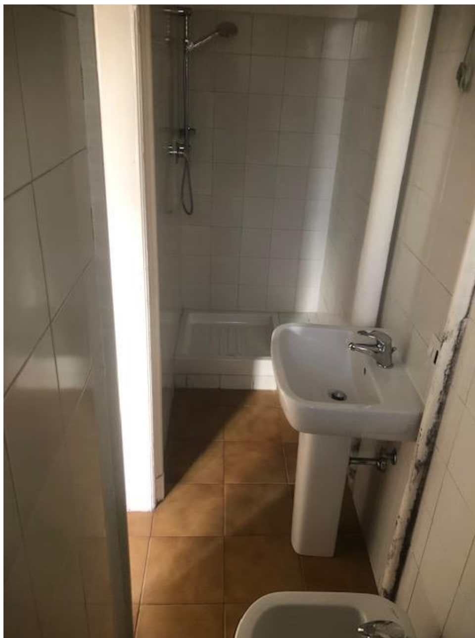
Vista del bagno