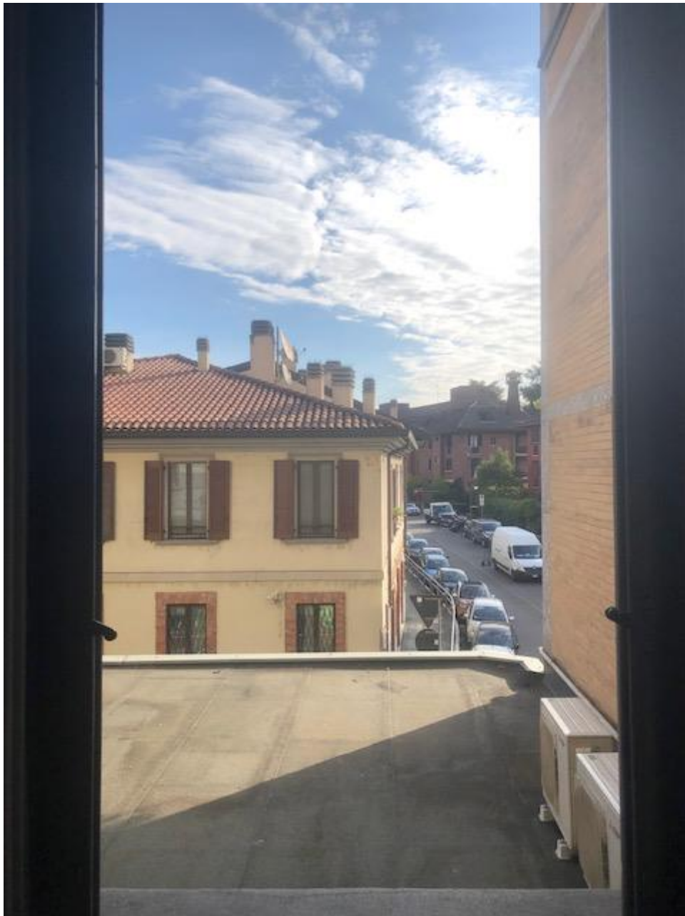
Vista dalla finestra della camera