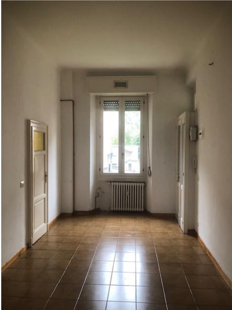
Vista del soggiorno