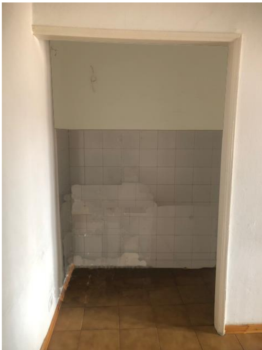
Vista della cucina