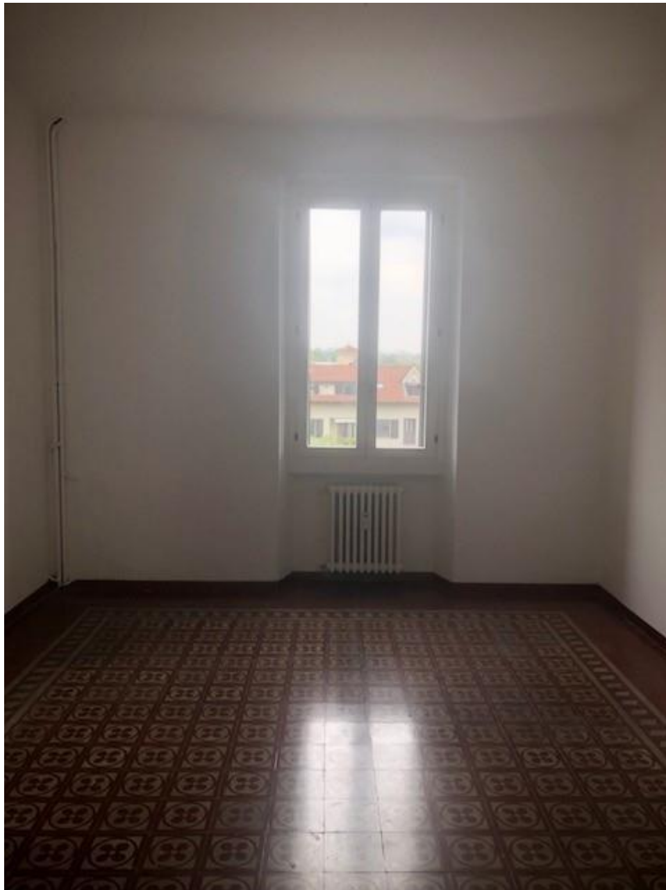
Vista della camera