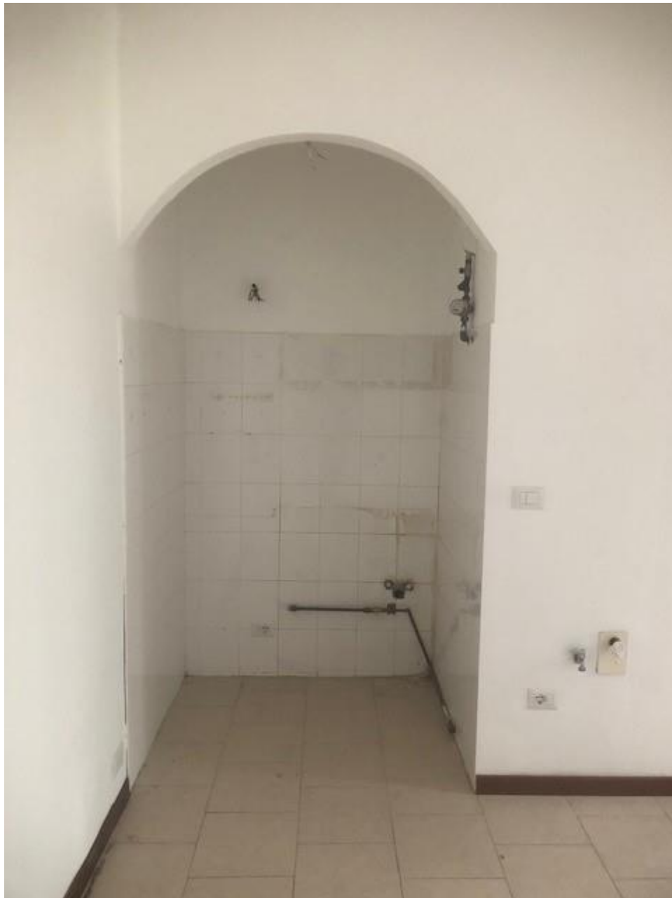
Vista della parete attrezzata