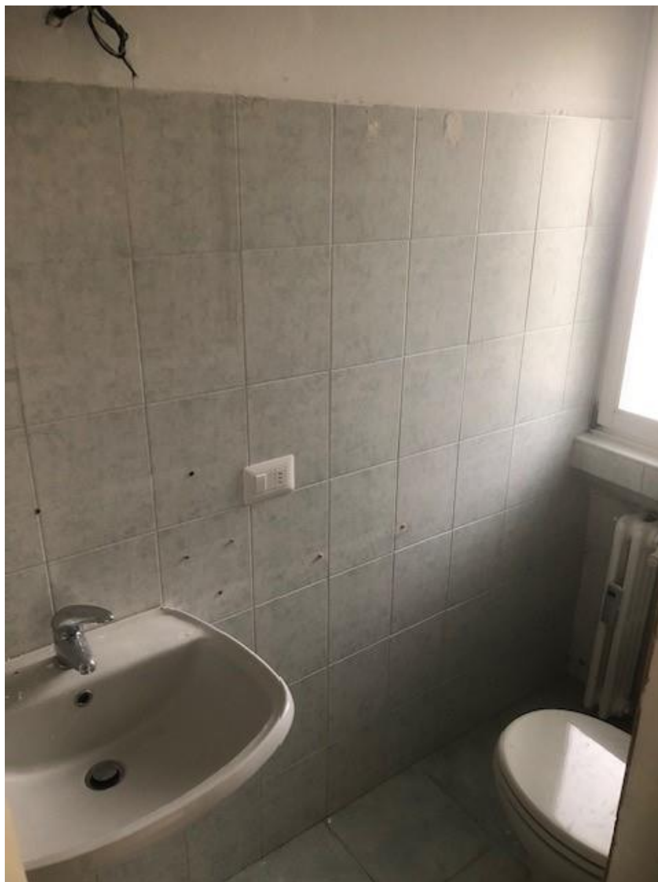
Vista del bagno