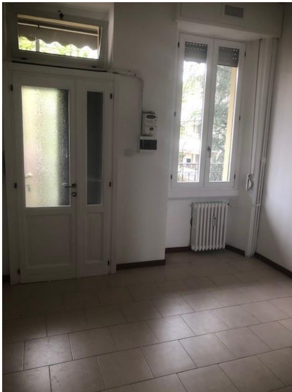
Vista del soggiorno

Alloggio: TRE15.0021, Via Trenno 15, Scala A11, P3