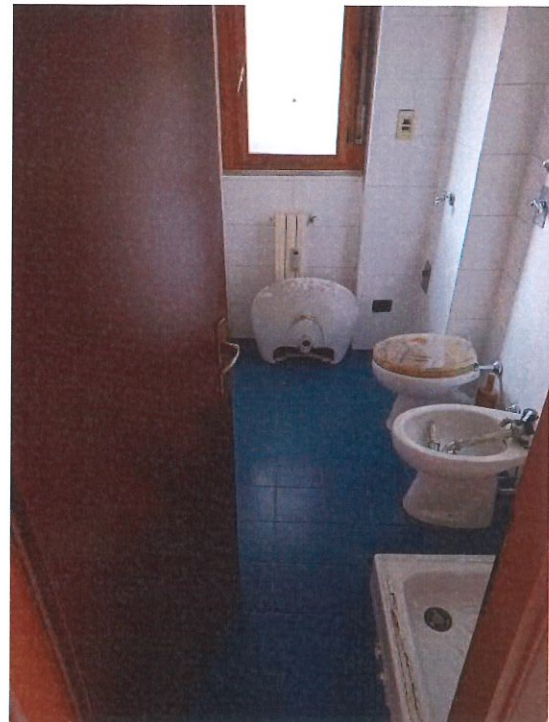
Vista dei bagni