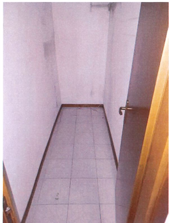
Vista del corridoio e ripostiglio