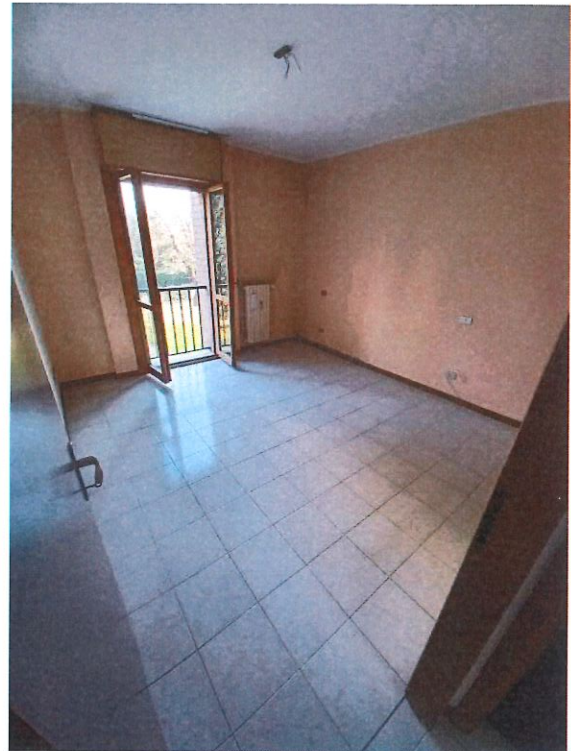
Vista delle camere