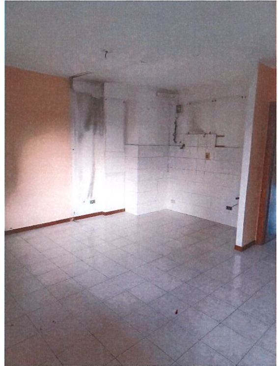
Vista della sala e cucina