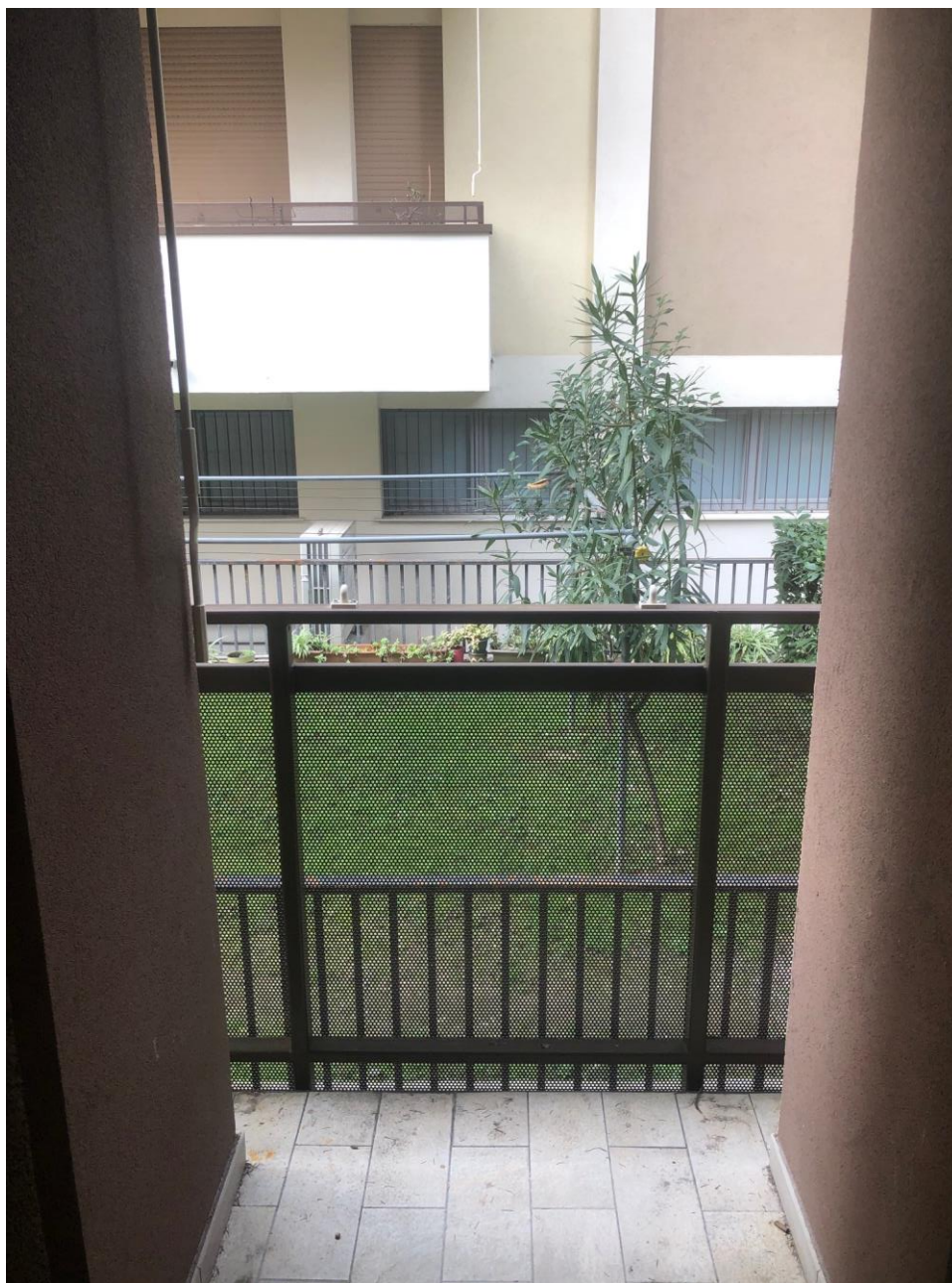
Vista del balcone