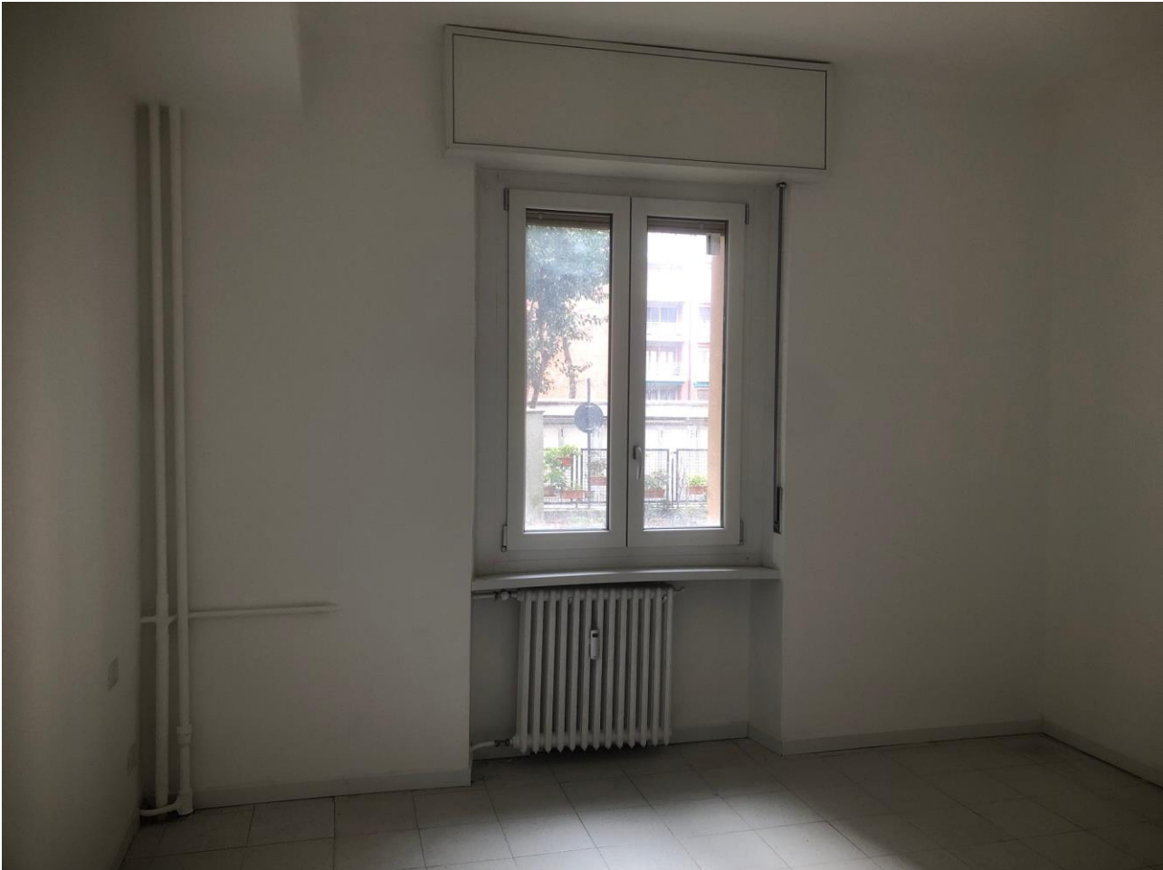
Vista della camera