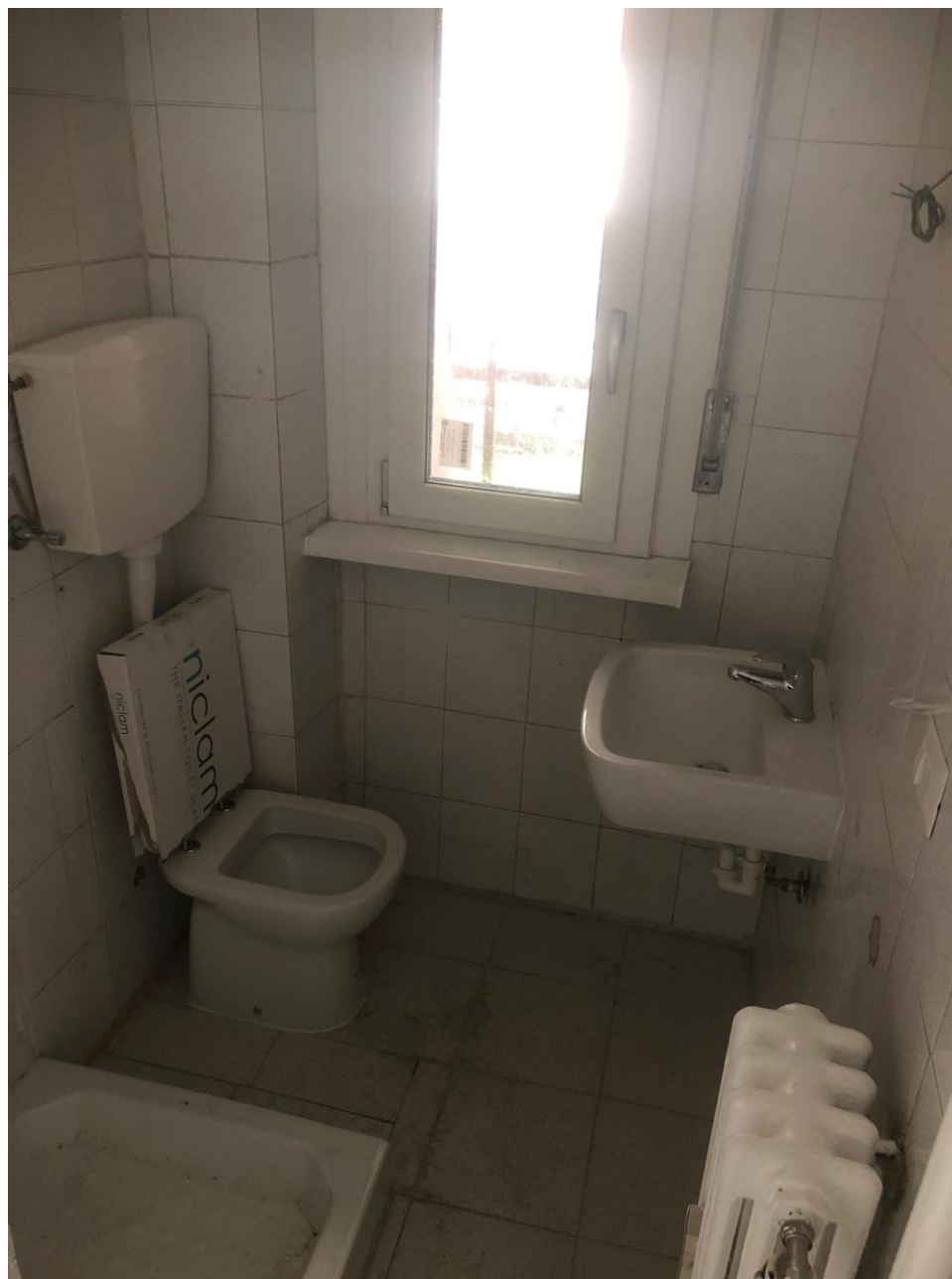
Vista del bagno