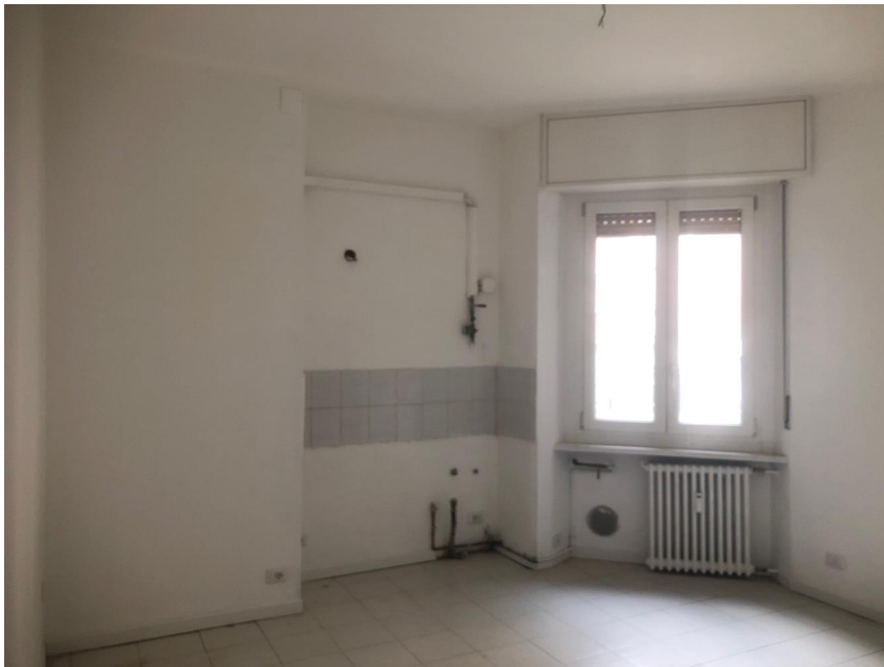
Vista del soggiorno

Alloggio: TRE15-0036, Via Trenno 15, Scala B11, P1