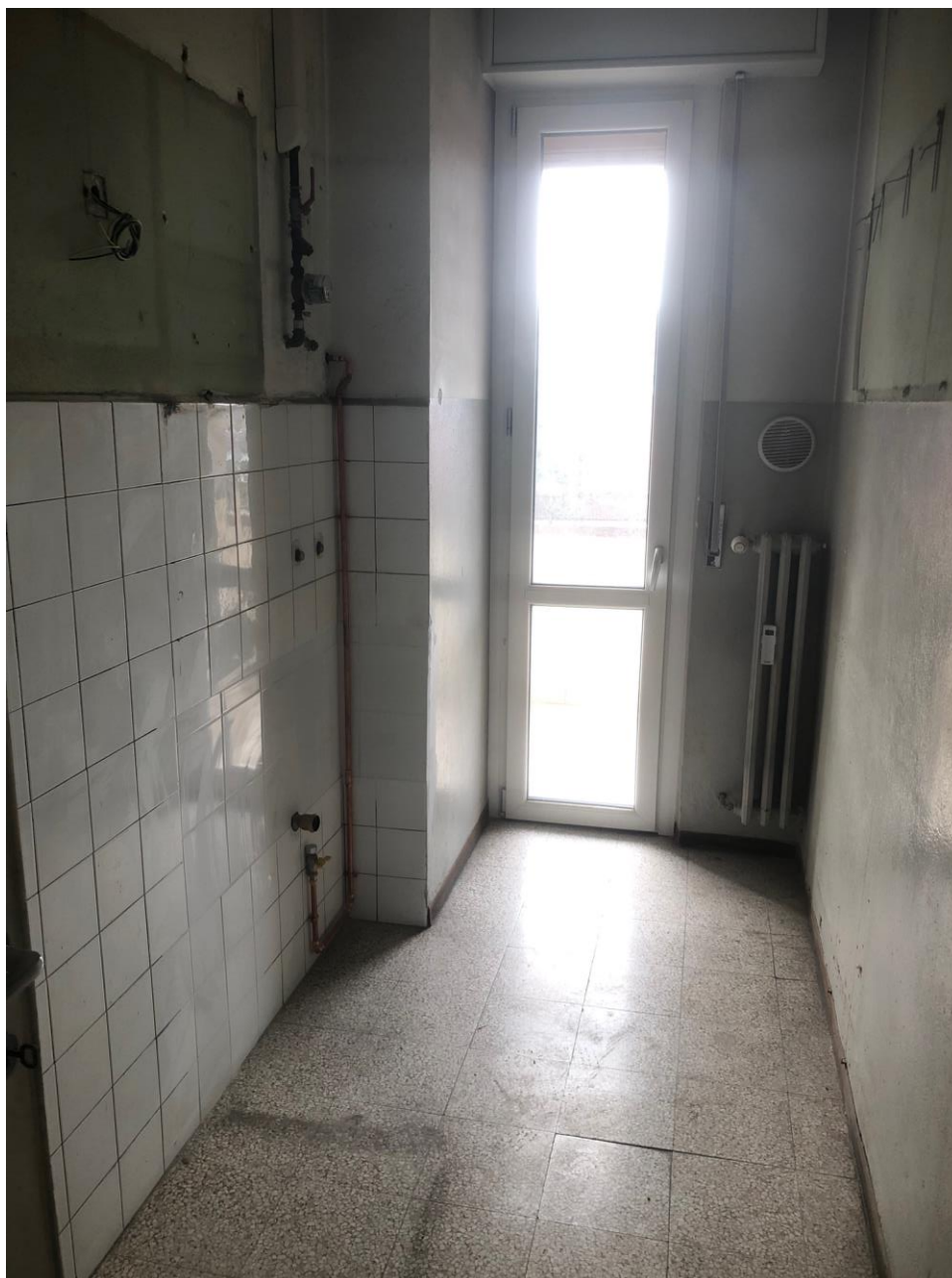
Vista della cucina