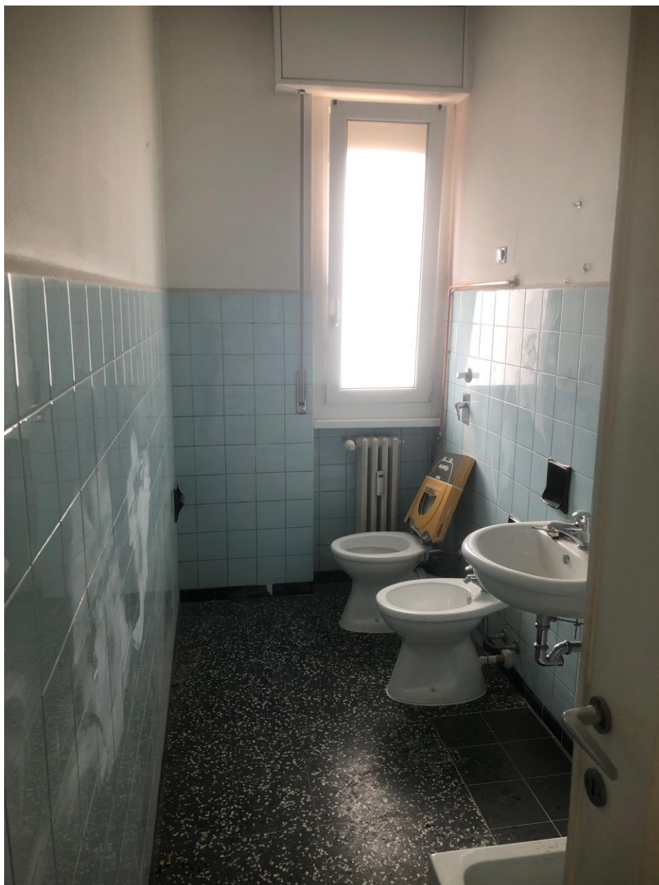
Vista del bagno