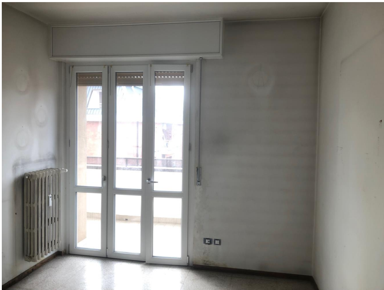
Vista della camera