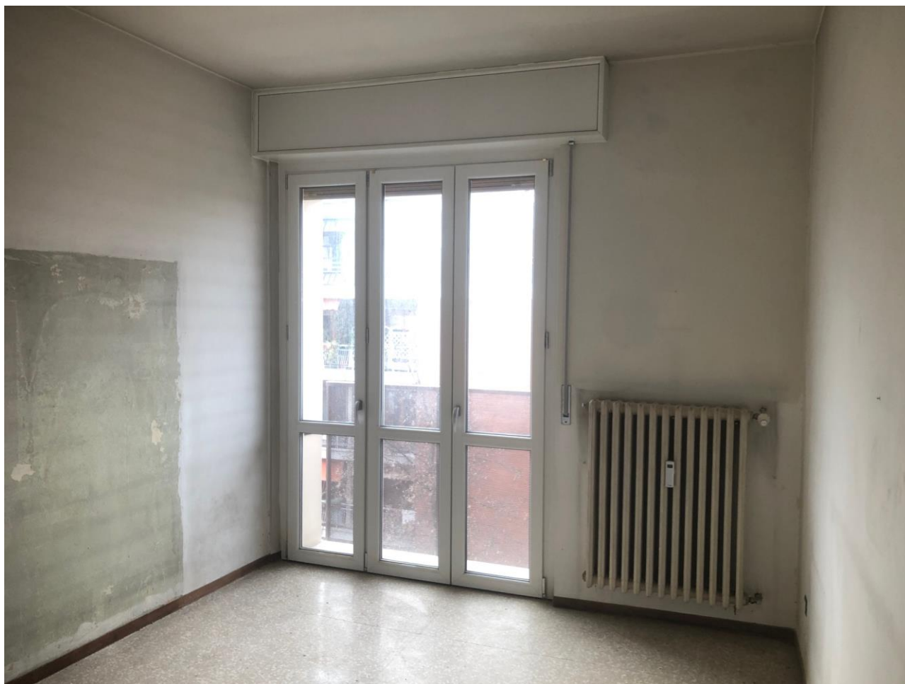
Vista del soggiorno

Alloggio: TRE15.0080, Via Trenno 15, Scala A, P4