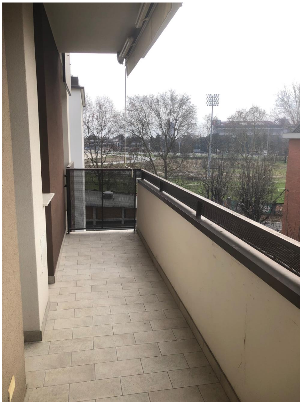
Vista dal balcone