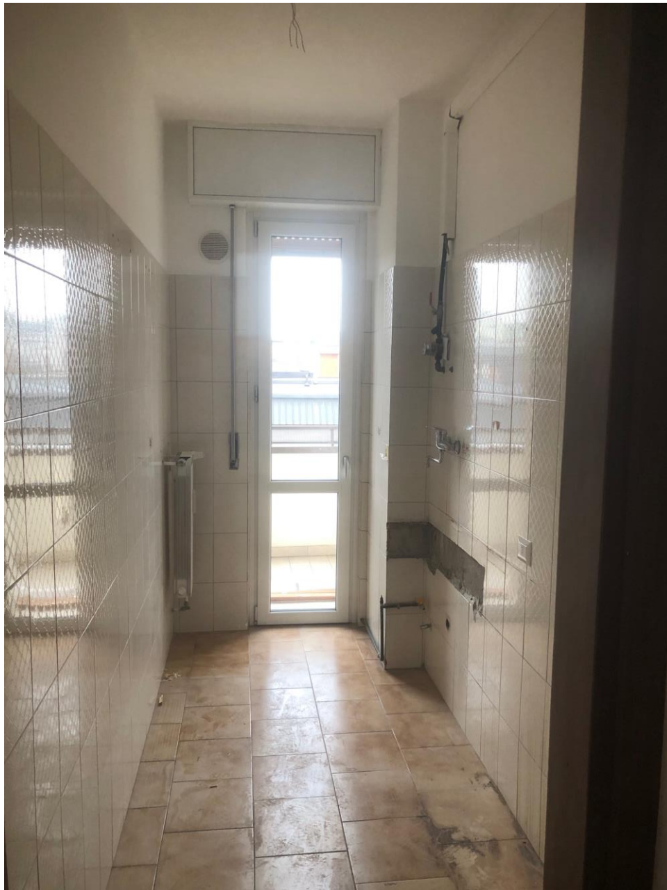
Vista della cucina