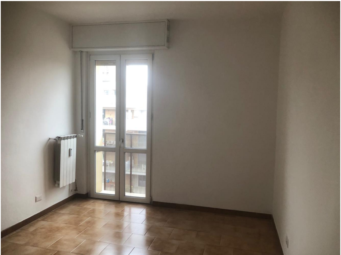
Vista del soggiorno