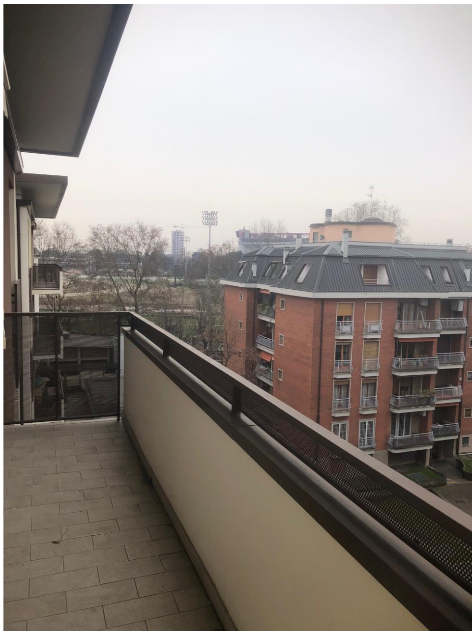
Vista dal balcone