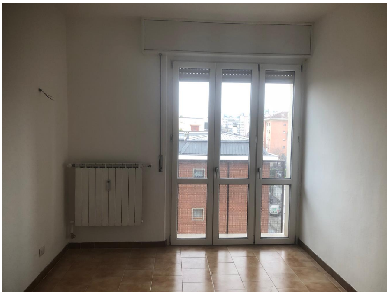
Vista della camera