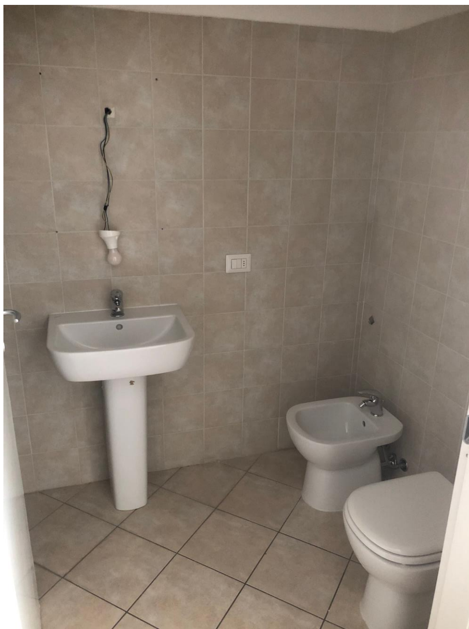
Vista del bagno