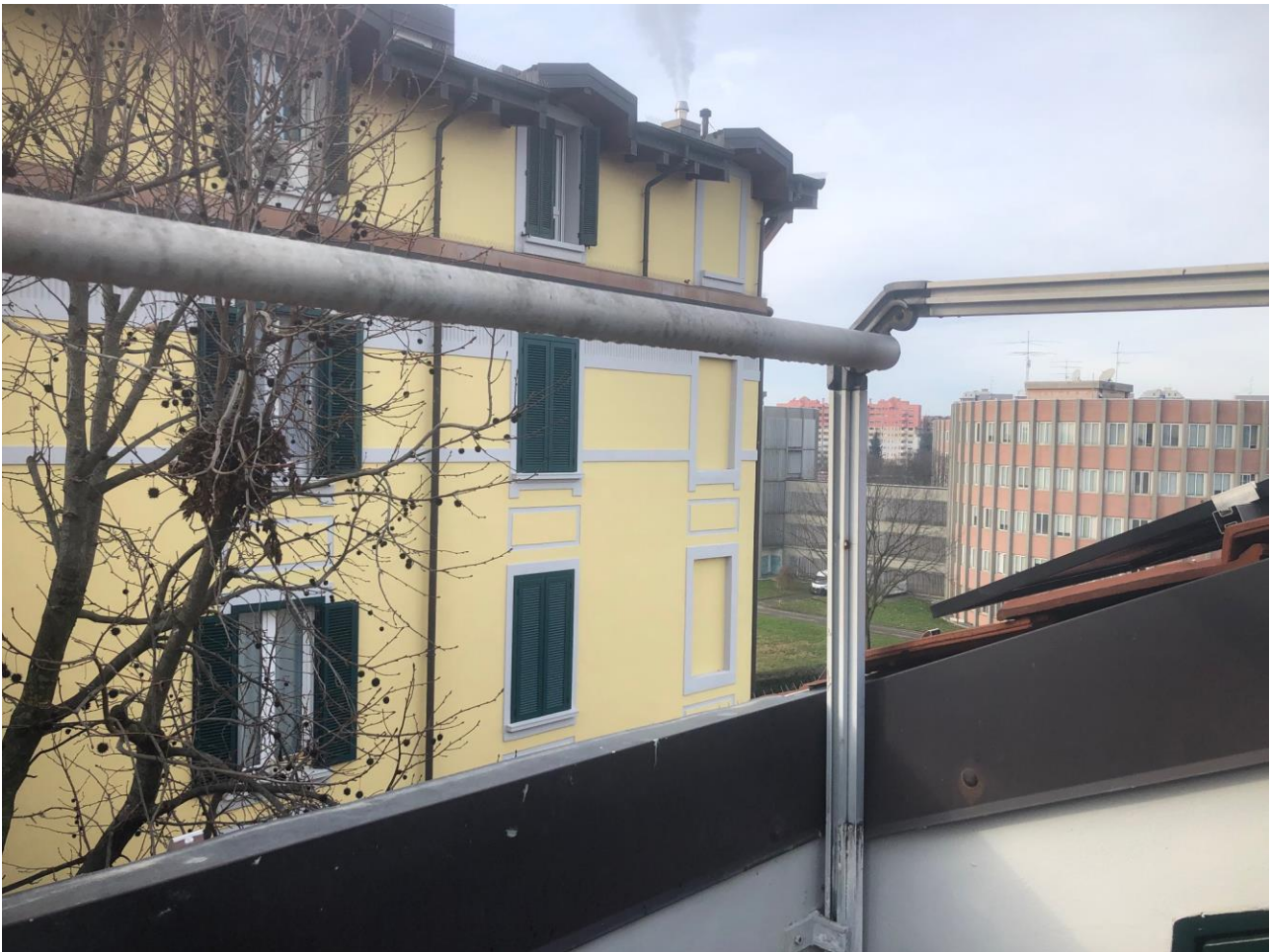
Vista dal balcone