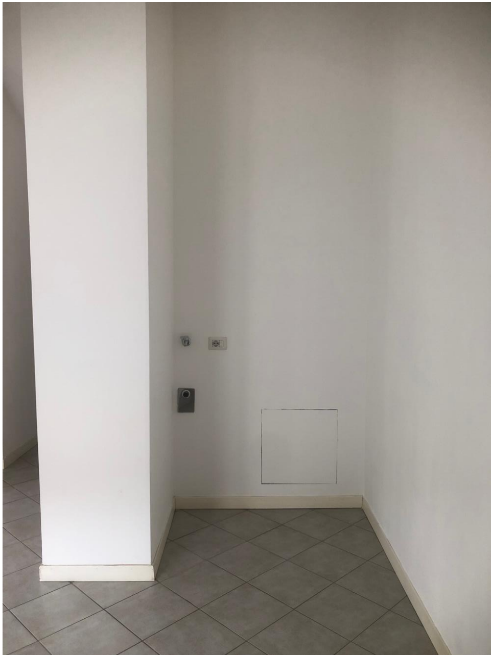
Vista dello spazio lavanderia