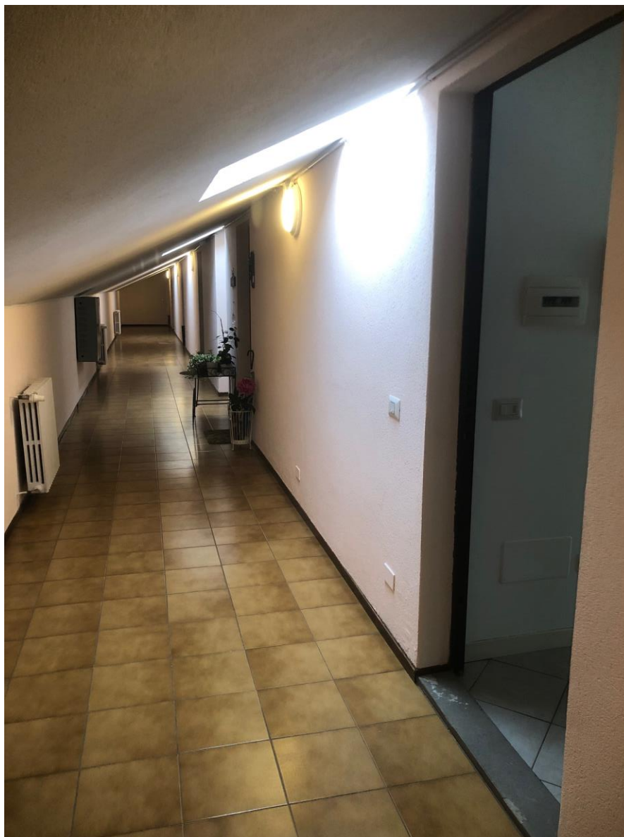
Vista del ballatoio verso l'alloggio

Alloggio: TRE41.0026, Via Trenno 41, Scala A, P4