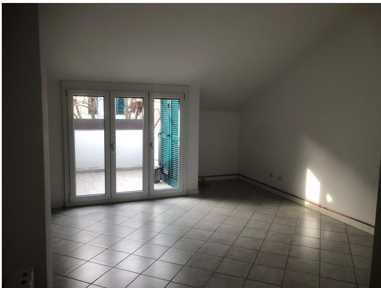
Vista dallo spazio giorno