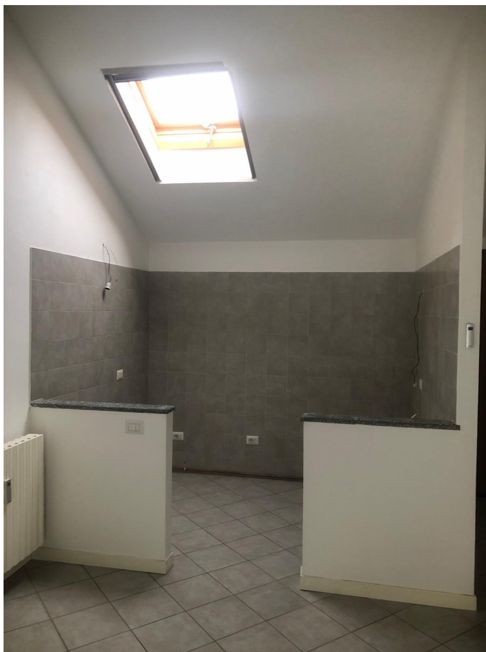
Vista dello spazio cucina