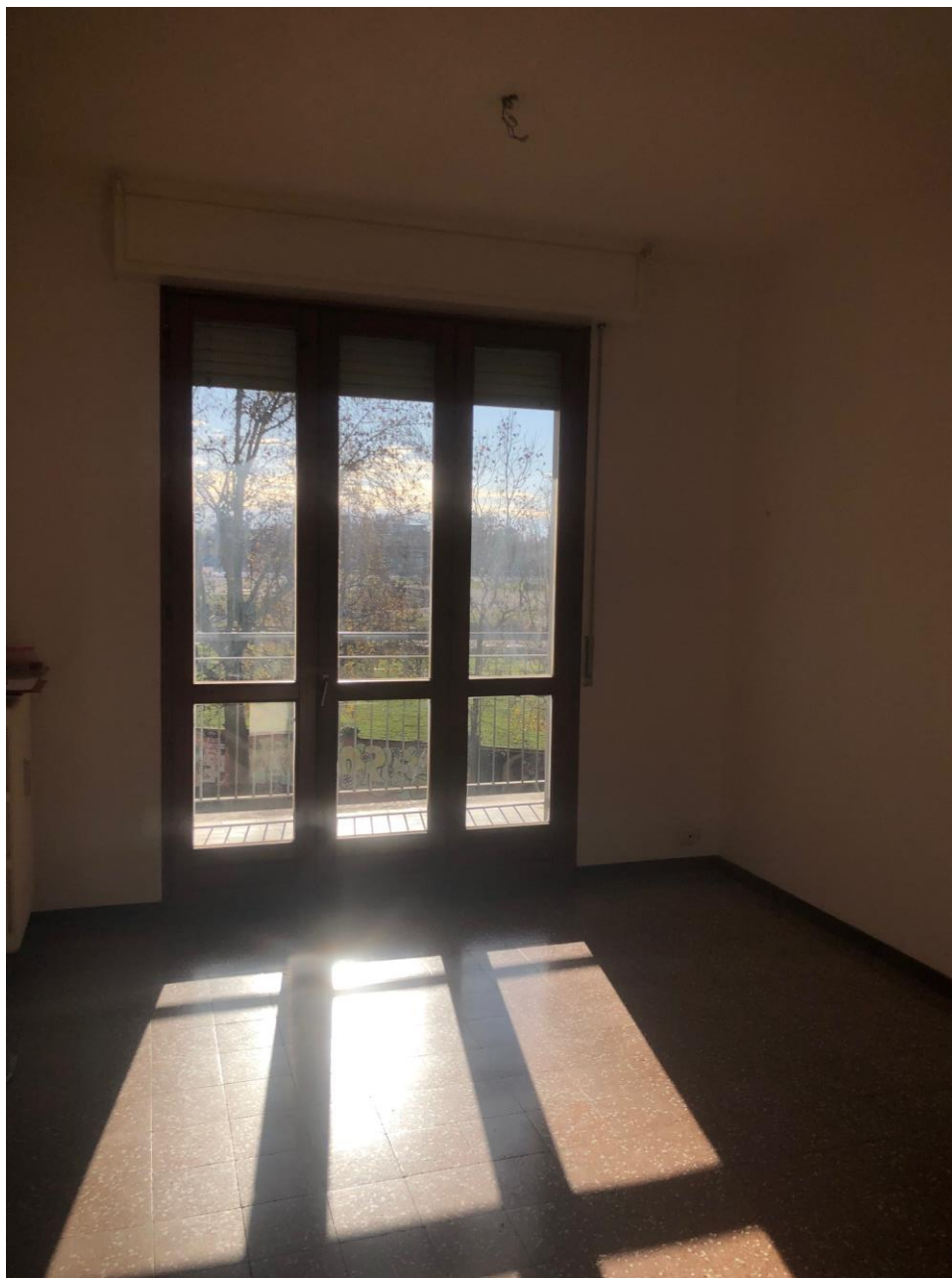
Vista del soggiorno

Alloggio: DIO.0011, Via Diomede 60, Scala B, P2