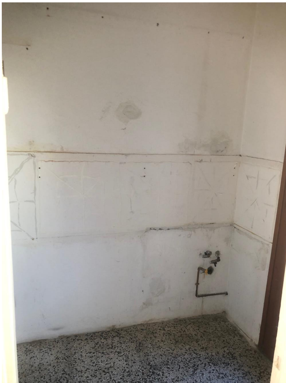
Vista della cucina