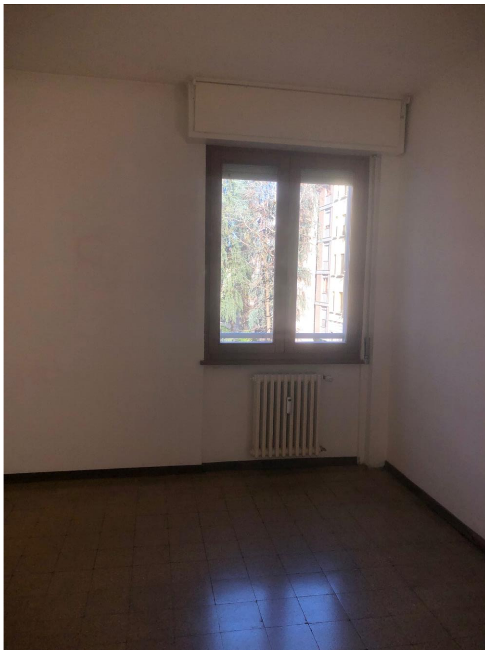
Vista della camera grande