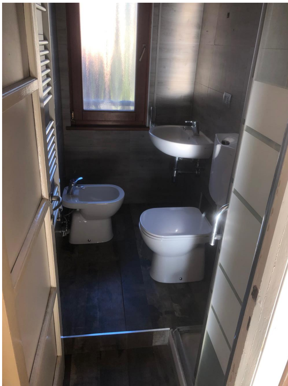
Vista del bagno