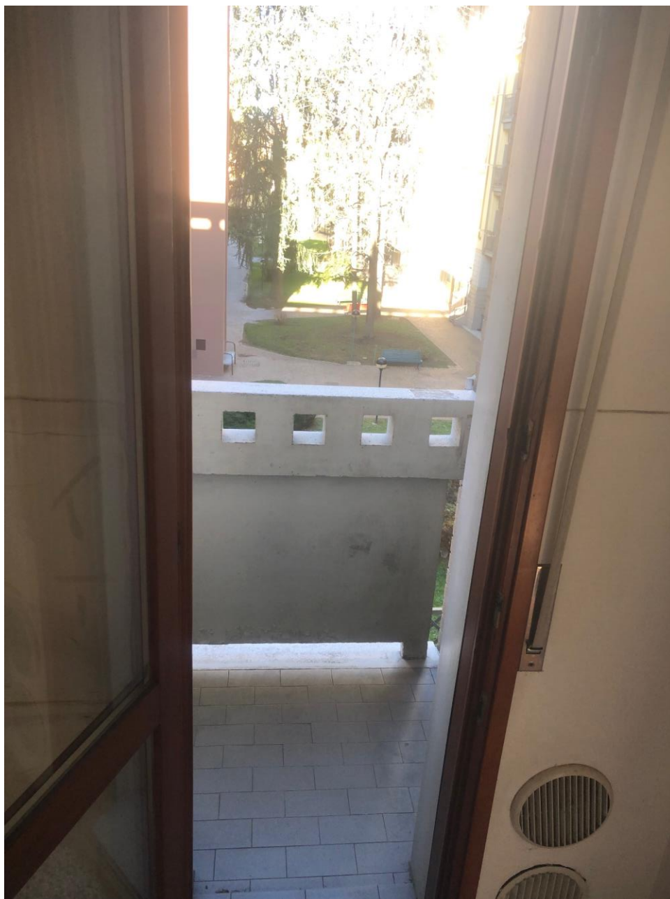
Vista del balconcino piccolo