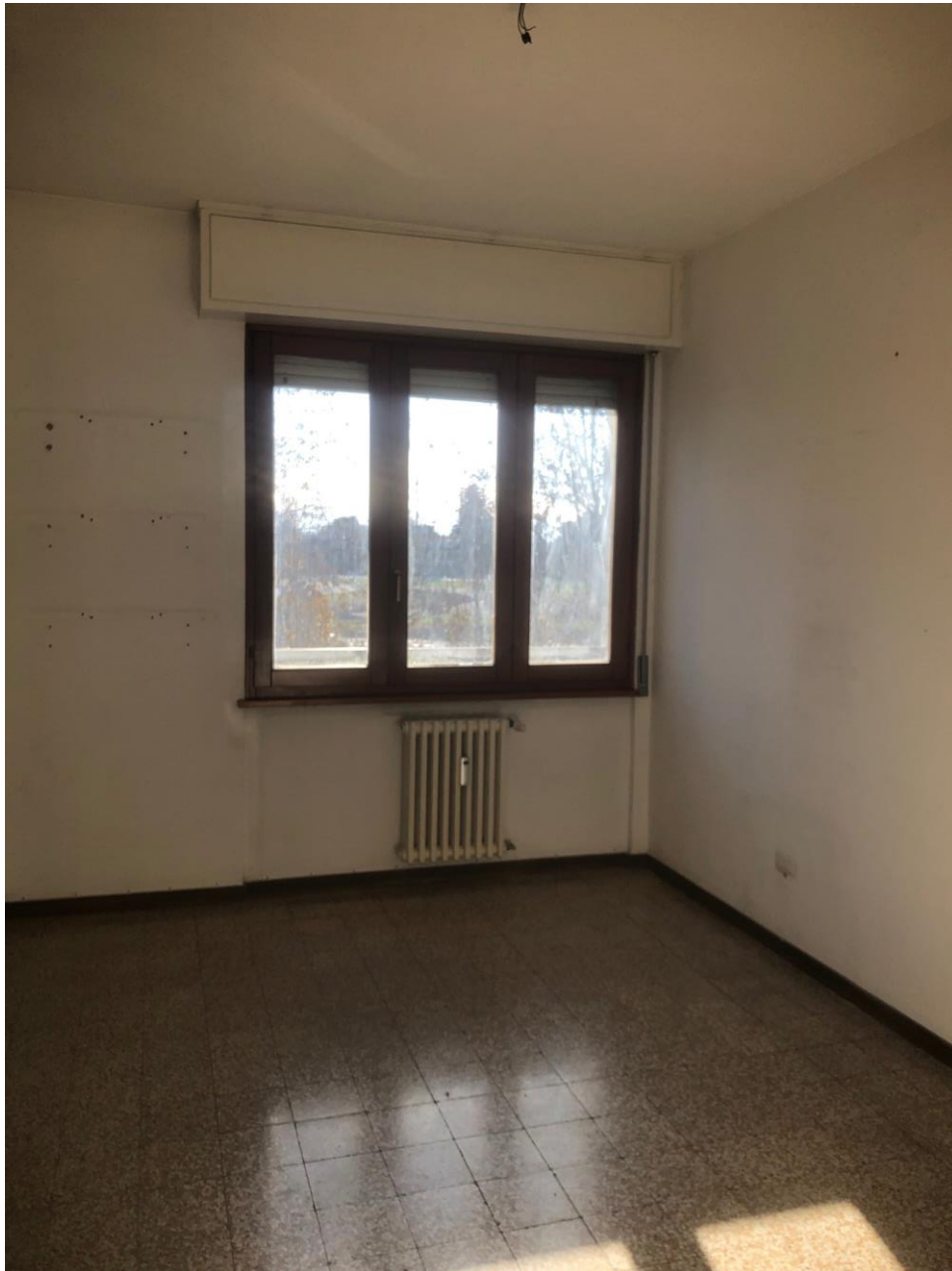
Vista della camera piccola