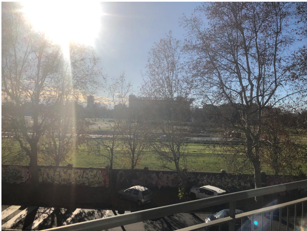
Vista dal balcone