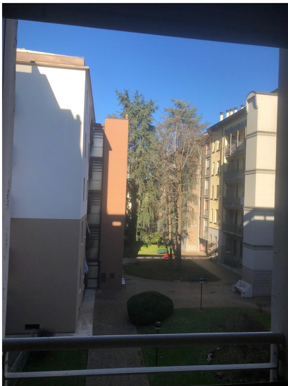
Vista del cortile interno dalla camera grande